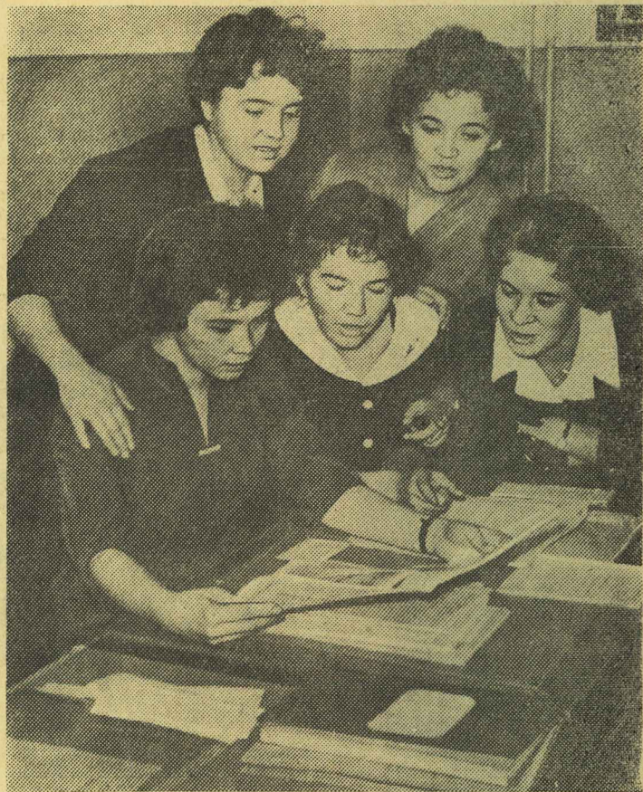
На снимке: студентки второй группы МТД просматривают техническую литературу, эта группа завоевала первенство в социалистическом соревновании на лучшую учебную группу института.