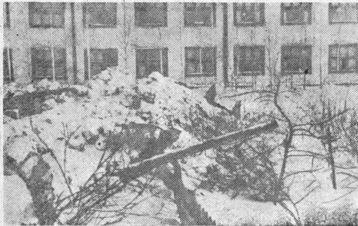
На снимках: вот что натворили в дендрарии «заботливые» руки наших хозяйственников.