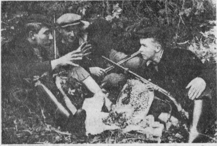
На привале почти охотники.