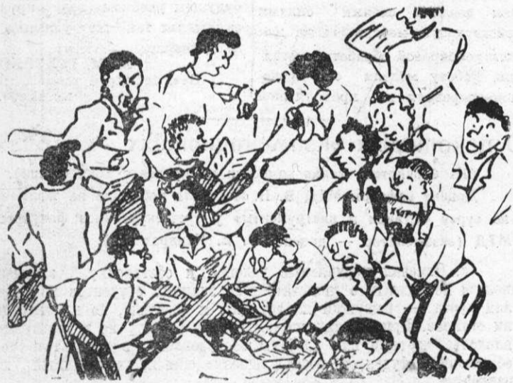
Так выглядит читальный зал нашего института в дни экзаменационной сессии (Читайте в предыдущем номере нашей газеты заметку Е. Н. Шаляпина «Библиотека в дни экзаменов»)