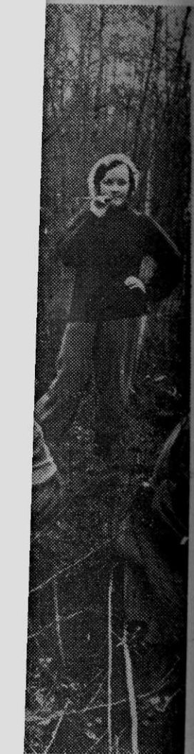
...километрах от... 546 человек... туристов... ассистент... курса... видите их среди... Э. ГИБШМАНА.