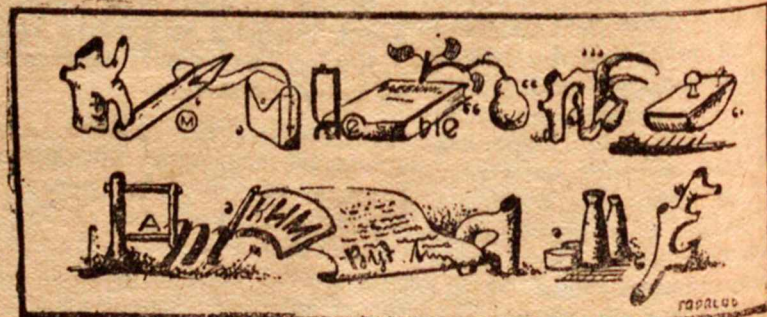
Ребус № 1.