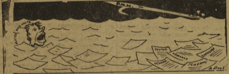
Необходимое орудие, дабы спасти утопающего.