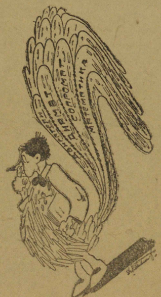
Разновидность «райских птиц», акклиматизированных в нашем вузе.