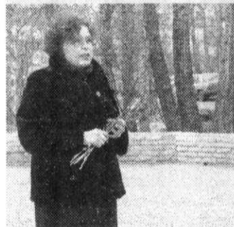
15 апреля университет вспоминал скорбную дату: 246 лет назад ушёл из жизни Михаил Васильевич Ломоносов