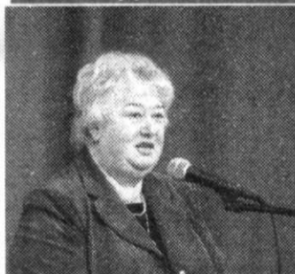
14 апреля отметило свое 20-летие Издательство имени В.Н. Булатова. Подробности о странствованиях издательского ковчега – на сайте romorsu.ru