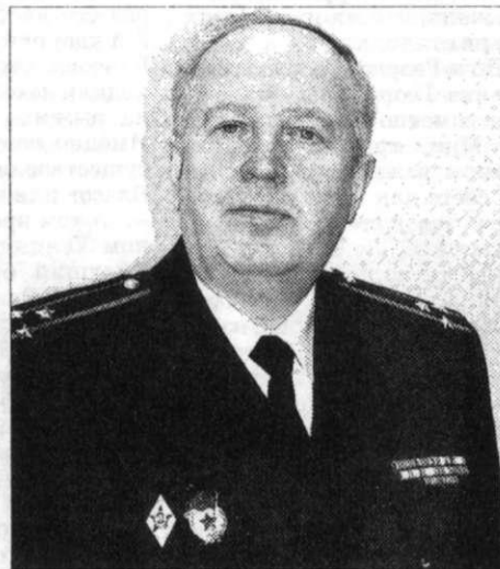
Настоящий полковник! Продолжение на стр. 6.