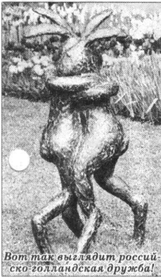
Вот так выглядит российско-голландская дружба!