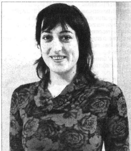
Голландский тюльпан в Архангельске. Продолжение на стр. 3.