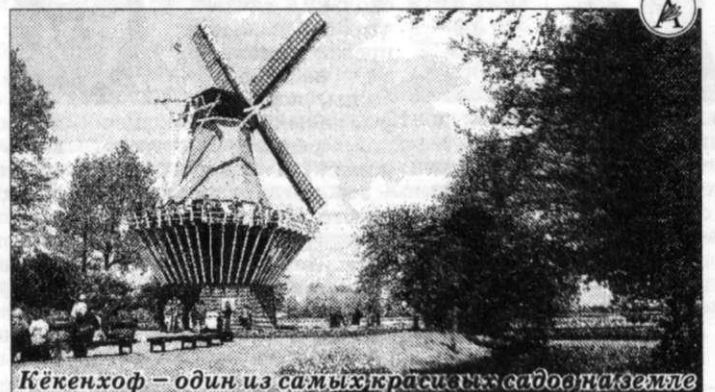
Кёкенхоф – один из самых красивых садов на земле

А совсем скоро наступит и сезон белых ночей, и кто знает, не заманит ли эта красота нашу гостью ещё на пару семестров?