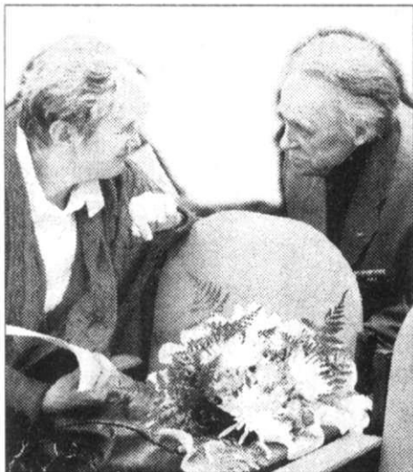
В Поморском университете состоялась презентация книги «Историк. Ректор. Гражданин». Продолжение на стр. 2.