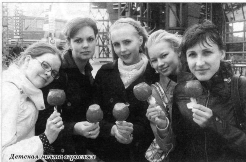
Детская мечта взрослых

Мне всегда были интересны культура и язык разных стран мира, общение с людьми других национальностей, поэто-