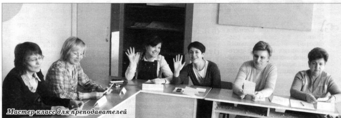
Мастер-класс для преподавателей

– Два года назад мы уже проводили такой день, но настолько масштабным он стал впервые. Если в прошлый раз декан выбирался и курировался преподавателями, то сейчас инициатива полностью перешла в руки студентов. И если изначально это была игра, то теперь мы решили привести элемент обучения. А ещё решили сделать из дня самоуправления небольшой