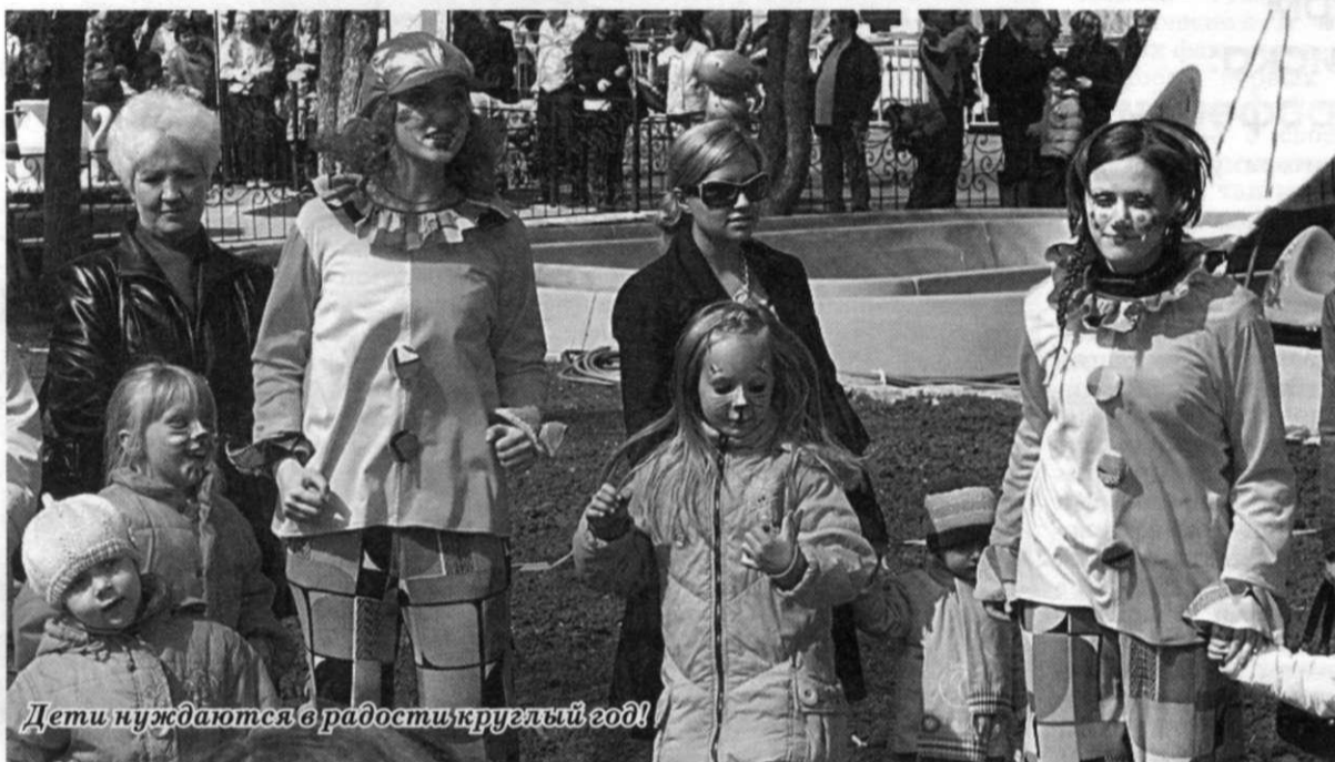
Дети нуждаются в радости круглый год!

Данная акция включает в себя облагораживание детских площадок в отдалённых округах Архангельска. В этом году планируются выезды в 10 детских садов, первыми из которых уже стали д/с «Лесо-