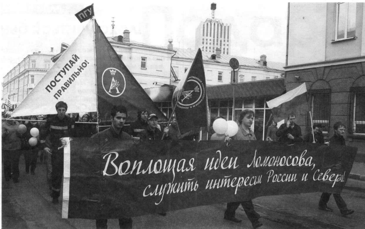
Первомайская демонстрация 2010 года впервые за много лет стала действительно демонстрацией солидарности трудящихся.