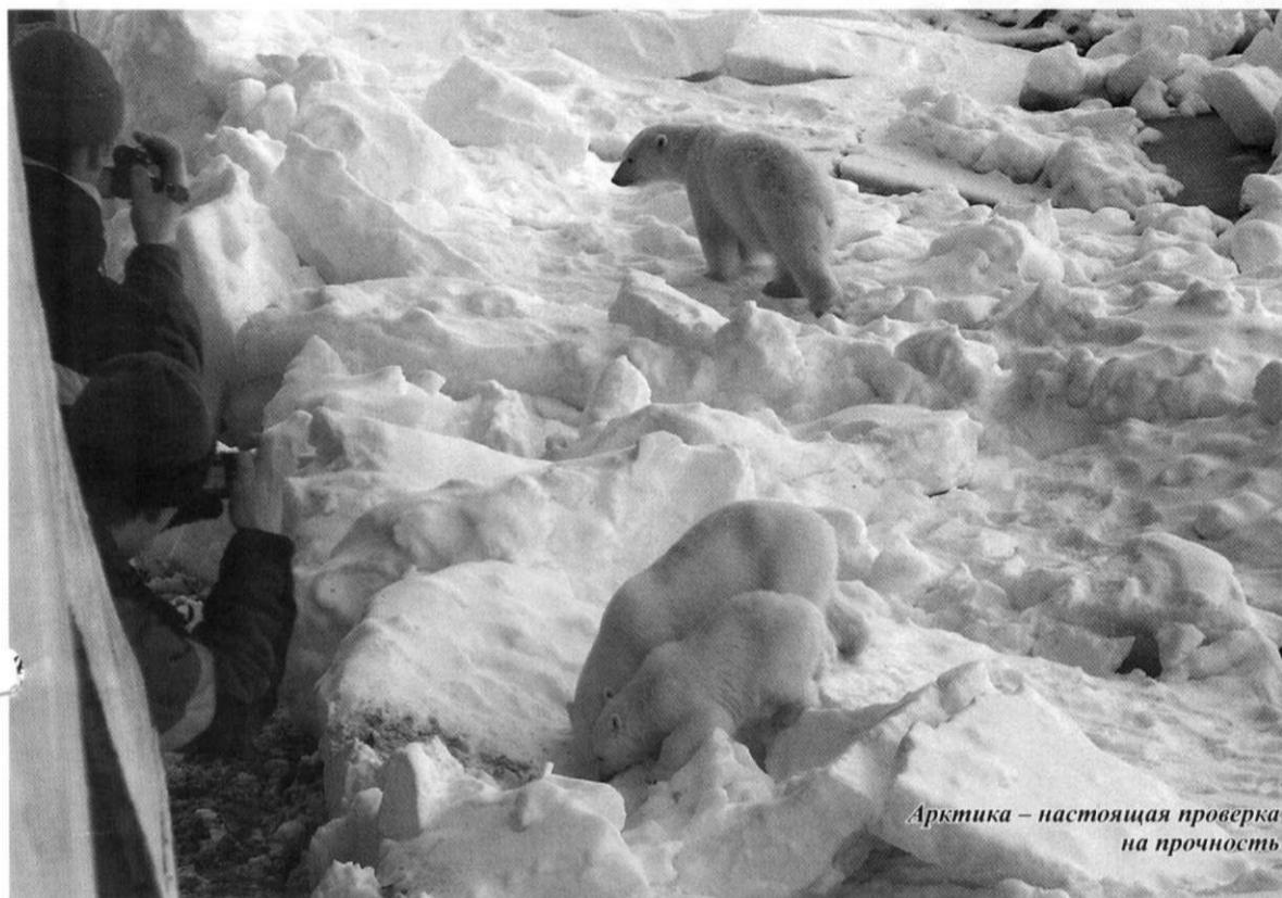
Арктика – настоящая проверка на прочность