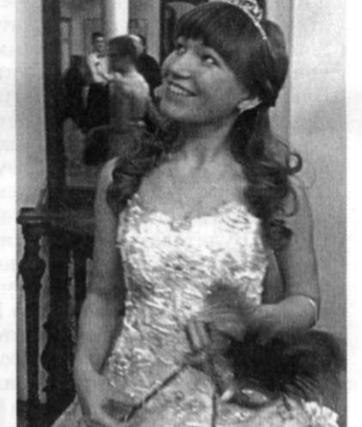
Традиционный университетский Рождественский бал стал настоящим праздником для студентов и сотрудников