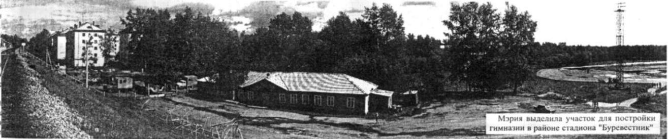
Мэрия выделила участок для постройки гимназии в районе стадиона «Буревестник»