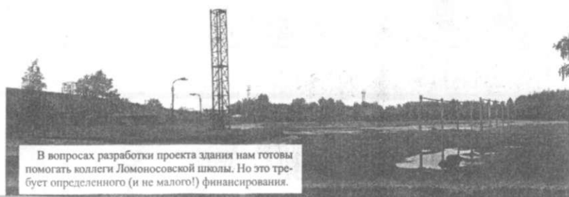
В вопросах разработки проекта здания нам готовы помогать коллеги Ломоносовской школы. Но это требует определенного (и не малого!) финансирования.

В Управление по борьбе с экономическими преступлениями найдены материалы о деятельности готворительных фондов и организаций "Прощение" и "Познание" помощью которых собирали деньги с родителей в нескольких столических школах.