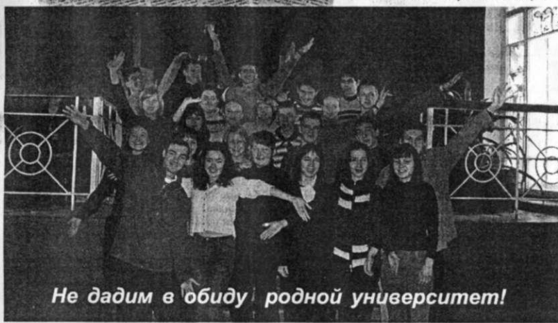
Не дадим в обиду родной университет!

таться к автору статьи. Кто изобрел "идею" поглощения? Речь идет об объединении, создании единого мощного научного комплекса. Безусловно, большинству это кажется явлением, близким к абстракции. Но при чем тут поглощение?