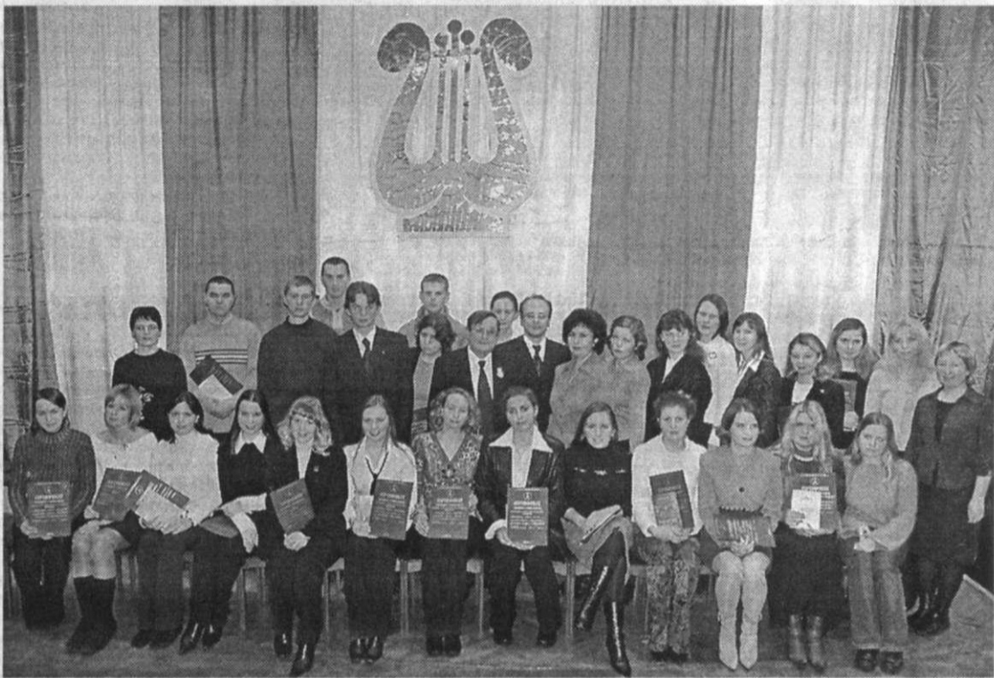
Именные стипендиаты на приеме у ректора

Смею утверждать, что на факультете работают влюбленные в свою профессию преподаватели, умеющие учить,