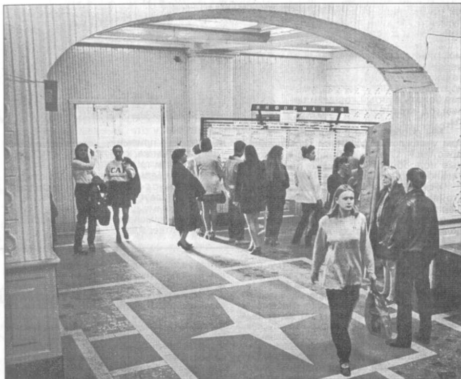
«Когда-то мы все звались абитуриентами...»

И вот, когда мы только-только на- чиная осваиваться в студенческой жизни СОВЕРШЕННО неожиданно пришла первая сессия. Кто-то из вели- ких сказал: «Экзаменов страшится