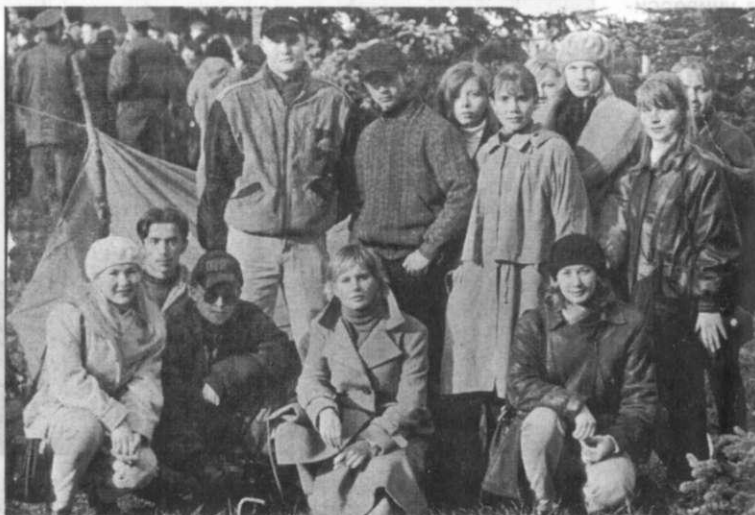
Выпускники отделения журналистики: «Когда-то и мы были первокурсниками...»

Многие пятикурсники отделения журналистики уже давно совмещают учебу с работой в СМИ. Да и тем более это первый в нашем университете вы-