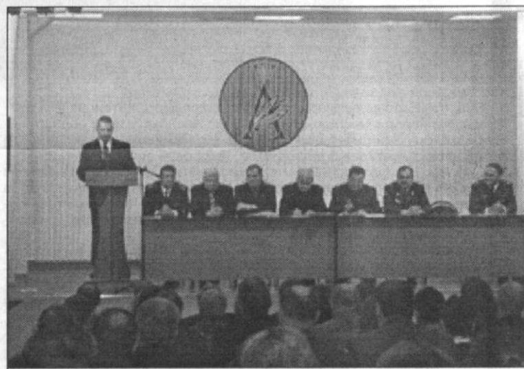
19 ДЕКАБРЯ прошло торжественное собрание, посвященное 10-летию Архангельского регионального центра переподготовки военнослужащих при Поморском государственном университете. На торжества с поздравлениями прибыли почти все руководители воинских соединений, расположенных в Архангельской области. На снимке: «генеральский» президиум торжественного собрания.

Кроме того, есть такое понятие как учебно-методический комплекс, в который входят программа курса, планы лекций, перечень лабораторных работ, подбор задач, контрольных работ и т. д. У нас все это хранится на кафедре и применяется чаще всего для ведомственных проверок. У них все учебно-методические материалы открыты для студентов и доступны в Интернете. Студент может зайти на соответствующую страничку и по-