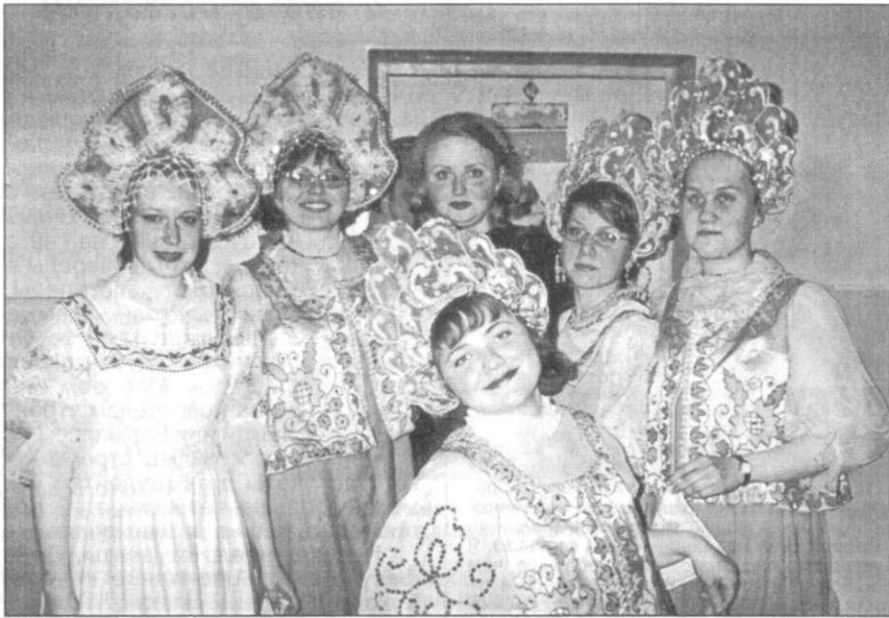
На снимке: студенты-филологи на Дне факультета, апрель 2002 г.

Не верьте тому, кто говорит, что быть студентом - это весело. Быть студентом - это очень весело. Когда ты студент, ты живешь жизнью, полной впечатлений и воспоминаний. Особенно если ты учишься в СФ ПГУ. «Почему?» - спросите вы. А потому, что мы не только учимся, но и отдыхаем. Год всегда начинается с праздника «Посвящение в студенты», далее - День здоровья, профессиональный День учителя, потом День факультета ДПП, за ним - День юрфака. Не успели отдохнуть - уже Новый год. И тут приходит сессия, но в этот период мы также не скучаем. День начинается с экзамена. Пока ждешь своей очереди зайти в кабинет, понимаешь, насколько однокурсники переживают не только за себя, но и за всех. Уже после первой сессии мы - не просто собравшаяся по какому-то поводу кучка людей, мы - коллектив.