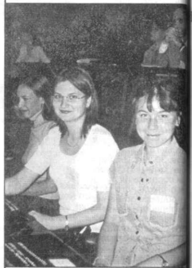
На снимке: студенты СФ ПГУ во Франции.

В начале сентября в г. Страсбург (Франция) проходила международная конференция ESSE-6. В ней приняло участие около 500 человек, среди которых были представители мировой из разных стран. В течение 5 дней проходили заседания различных секций, организована великолепная культурная программа, благодаря которой мы смогли осмотреть все достопримечательности города. Из России нас было несколько человек, говорить с другими приходилось только на английском языке. Очень приятно было общаться с интересными и интересными людьми. Мы тупали на секции «Английская филология», где были заслушаны доклады лингвистов из Латвии, Германии, Швеции, Венгрии, Швейцарии, Франции.