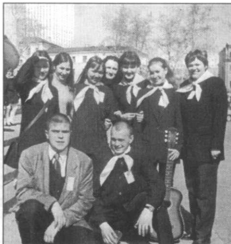
На снимке: студенты клуба «Перекресток».

Под ногами хрустит снег. Холодно. Высокий забор и метры колючей проволоки. Кажется, мы никогда не дойдем до цели. Так начиналось наше знакомство с Архангельской воспитательной колонией. 19 девчонок-первокурсниц, тогда мы еще не совсем понимали, зачем сюда приехали. Было любопытно просто посмотреть, какие они, заключенные... И представлялись... угрюмый исподлобья взгляд, цепкие, грубые руки, холодное молчание и мятая папироза в углу рта... Папироза и правда была - курят почти все, но зато все остальное встречалось куда реже. Во всяком случае после первого знакомства страх куда-то исчез.