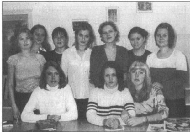
На снимке: студенты третьего курса.

Ну а в декабре студенты отмечают День рождения факультета. В 2001 году праздновалось шестилетие: и где бы вы думали? Да ну, что вы! Нет! Это происходило на турбазе в Бабонегово! Все здорово повеселились и отдох-