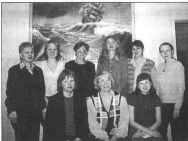
На снимке: преподаватели факультета.

В настоящее время факультет ведет целый ряд международных проектов совместно с высшими профессиональными школами Германии: Проект по программе Александра Герцена «Обучение социальной работе в Архангельске», с региональным университетом г. Будё (Норвегия) - «Помор-проект-профессионализация в социальной работе», с Лапландским университетом (Финляндия) - «Обучение социальной работе».