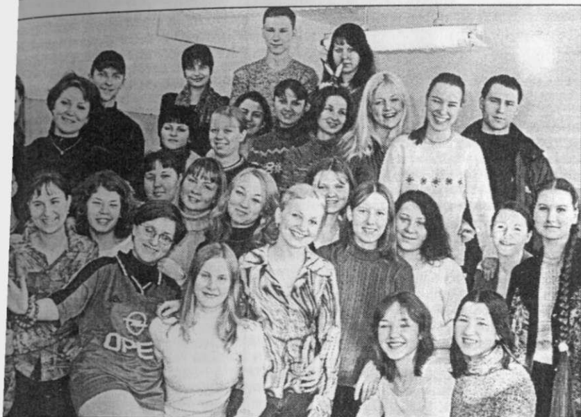
На снимке: те, кто готовил для вас этот выпуск, - студенты I курса ФФиЖ отделения журналистики.