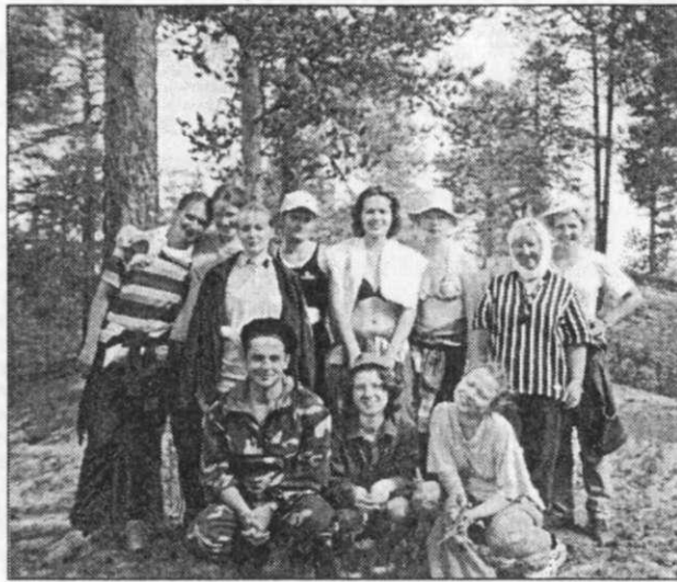
На снимке: студенты ЕГФ на практике. Кий-остров.

Существуют и свои факультетские традиции, соблюдаемые уже много лет. Например, поход первокурсников, турслет, день ЕГФ, вечер встречи выпускников. А также