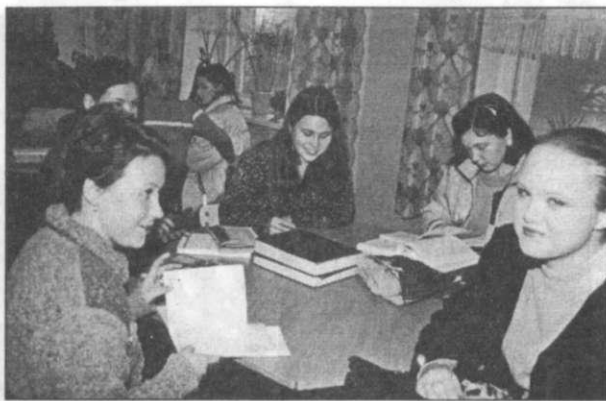
На снимке: а пока наше любимое место встреч - столовая...

су организации культурных вечеров. Также хотелось бы, чтобы межфакультетское общение осуществлялось более организованно».