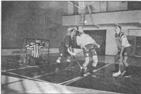
На снимке: сборная ПГУ по флорболу

Кстати, этому виду деятельности студенты уделяют немало времени. Это доказало первое соревнование между факультетами - легкоатлетическая эстафета, которая состоялась 27 сентября на стадионе «Буревестник». После та студенты показали отличные результаты. Уже с первых мгновений зрители и спортсмены знали, что будет настоящая битва. Так и произошло, особенно у юношей. Только в последние секунды выявились победители. В итоге первыми оказались историки, т. к. очень умело и тактично построили ход эстафеты, второе место заняли физики, а третье - юноши естественно-географического факультета. Незабываемым зрелищем оказалось соперничество у девушек. Они, словно быст-