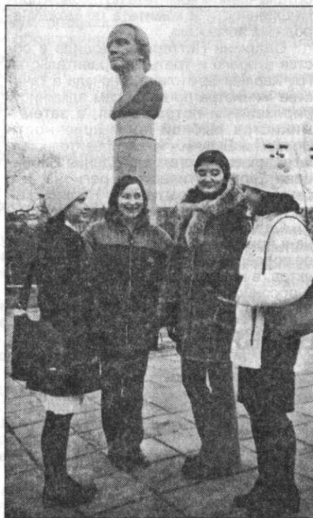
На снимке: студенты II курса отделения журналистики ФФИЖ.