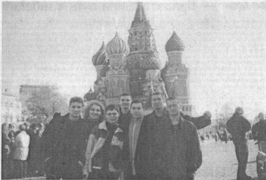
Сборная КВН ПГУ в Москве на Красной площади