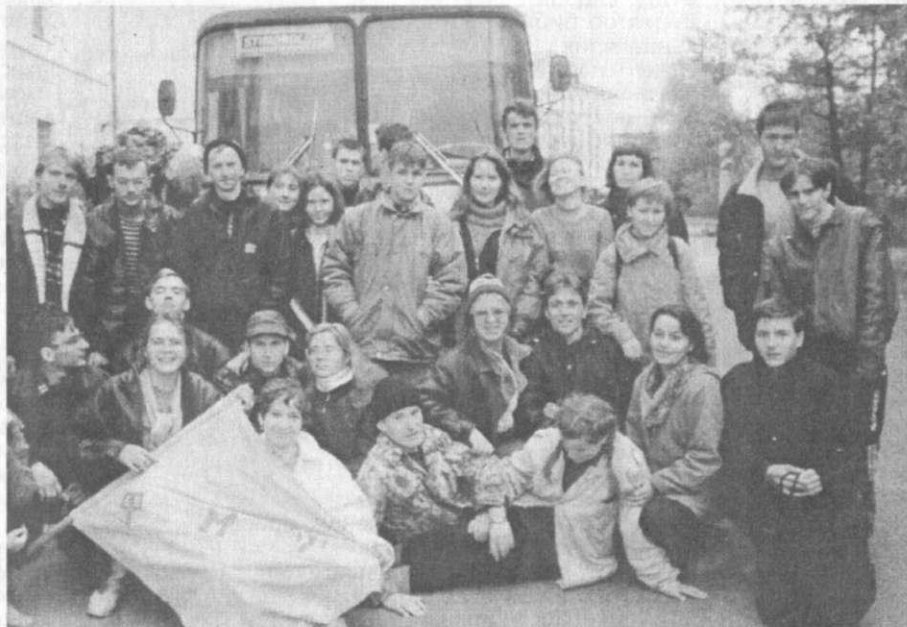
На снимке: первый курс физфака вернулся из похода.

Вот уже который раз у нас опять первый: первое слово, первый шаг, пер- вый класс, а теперь вот и первый курс. Всегда приходится с чего-то начинать, причем начинать практически с пустого места. И не потому, что кто-то не слиш- ком одарен, а просто студент - это со- вершенно необъяснимая и загадочная субстанция, всегда чего-то требует, а чего хочет - сам не знает. Вот и при- ходится угадывать. Заранее наверняка из- вестно только одно - его надобно учить. Учить не чему-нибудь и как-нибудь, а тому, чему захочет учиться сам нена- глядный.