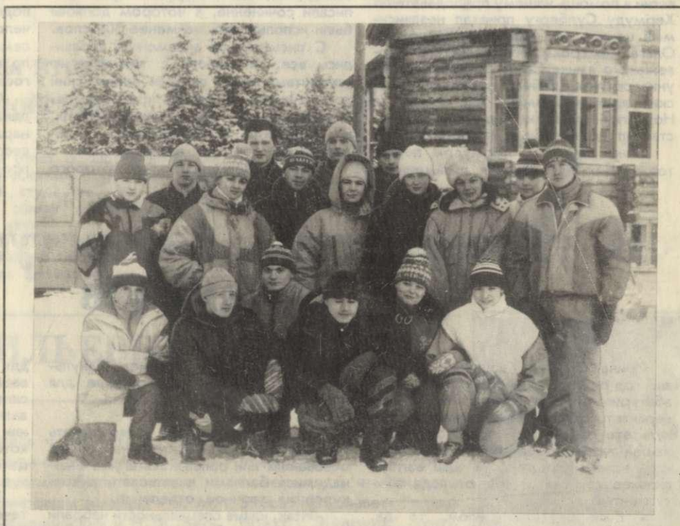
Группа спортсменов запечатлена в Малых Карелах. Спортсмены с факультета физвоспитания неплохо потрудились на зимней лыжне прошлого сезона, о чем читайте на 4-й странице нашей газеты.

Заканчивается ремонт и модернизация сорока комнат общежития. Отныне эти помещения будут использоваться для приезжих преподавателей и иностранных студентов, которые со следующего года начнут обучаться в нашем университете.