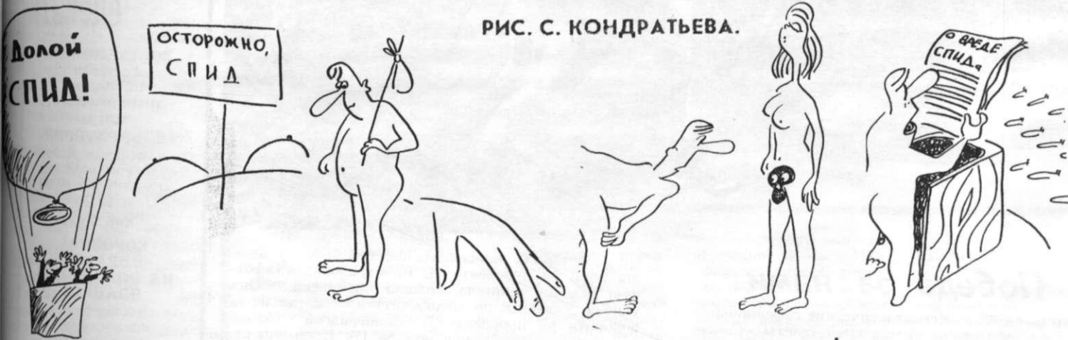
РИС. С. КОНДРАТЬЕВА.