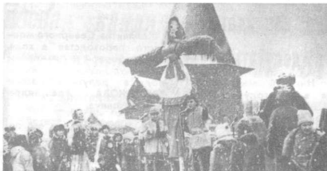
На снимке: масленица.

МАРТ: 14 — Евдокия. Евдокия красна и весна красна. Какова Евдокия, таково и лето. На Евдокию снег — к урожаю, теплый ветер — к мокрому лету, ветер с севера — к холодному лету. 15 — Федот. На Федота снежный занос — долго травы не будет. 18 — Канон. Если на Канон ведро, то града летом не будет. 22 — Сорока. Вторая встреча весны. 40 пичуг прилетает. Увидел скворца — весна у крыльца. 30 — Алексей. С гор потоки.